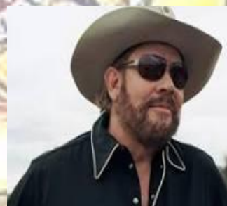
Hank Williams Junior

Randall Hank Williams alias Bocephus, est le fils de Hank Williams Sr., un pionnier dans la musique country (1923-1953). Hank Jr. chantait les chansons de son père sur scène dès l'âge de 8 ans (son père est décédé quand Hank Jr. n'avait que 3 ans). Hank Jr., après un passage à vide, a trouvé son style de country – un mélange de blues, rock et honky tonk.