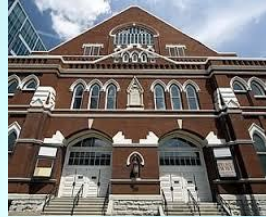
GRAND OLE OPRY

J'irais prendre un verre avec Dolly Après l'Opry Verserais un verre pour Tammy aussi Je sortirais mes strass Mettrais du verni à ongles Enfilerais mes chaussures pour danser Salut Loretta Mets une pièce dans le jukebox On chantera avec toi Et on parlera des hommes Car c'est ce que les femmes font